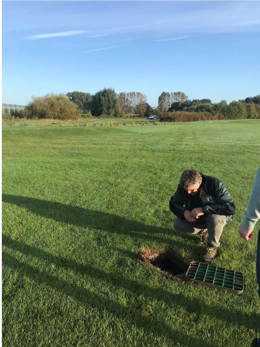
Aansluitpunt vanaf de tee met op de achtergrond de site

Na de installatie van de berekening zullen we beoordelen of er zones nog moeten bijgezaaid worden.